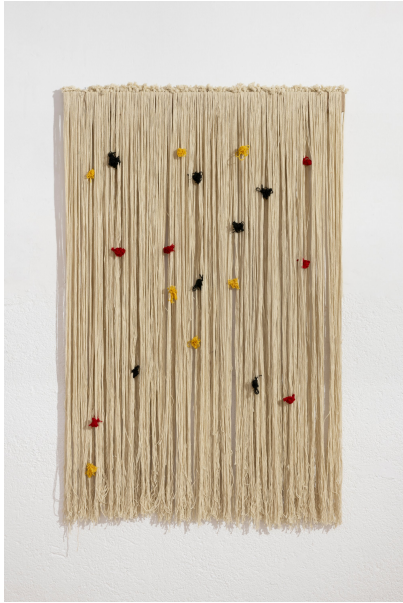
Título: Semilla Artista: Antonio Pichillá Año: 2024 Técnica: Hilos de lana Dimensiones: 160x105x4 cm Descargar