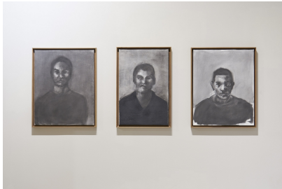
Título: Retratos del Twitter Artista: Antonio Romero Año: 2022 Técnica: Grafito y acrílico sobre lienzo Dimensiones: 55x130 cm Descargar