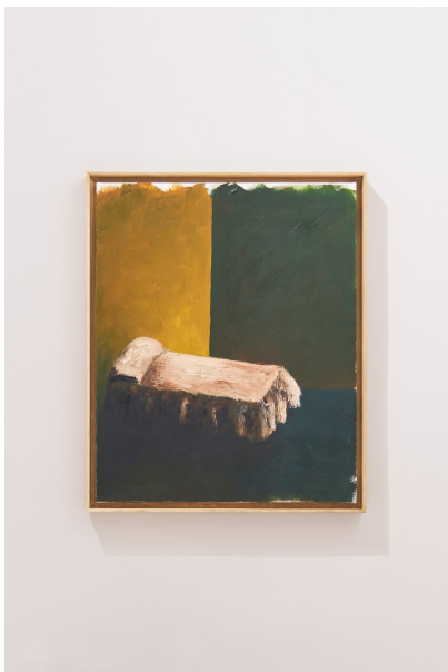
Título: Aislamiento Artista: Antonio Romero Año: 2020 Técnica: Óleo sobre lienzo Dimensiones: 55x45 cm Descargar